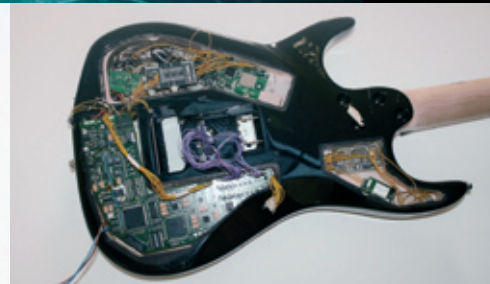
ESEMPIO DI PROTOTIPO

ZD MechaTronics s.r.l., Via Ticino 30/G 20064 Gorgonzola (MI) Italia Tel. +39 02 95746283 - Fax +39 02 95744254